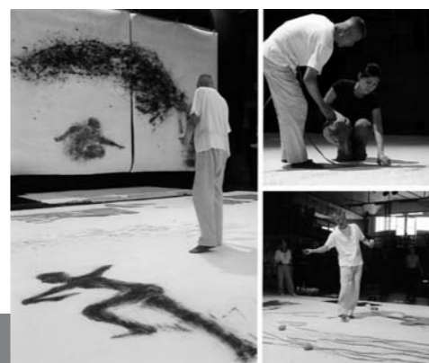
蔡國強 (Wind Shadow) 2006

*掲載された作品は参考作品であり、あいちトリエンナーレ2010に出品されるものとは限りません。