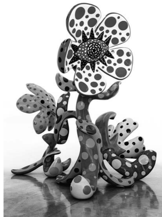
草間彌生 Yayoi Kusama Studio Inc.

普通チケット 1,400円 ペアチケット 2,600円 フリーパス 3,000円